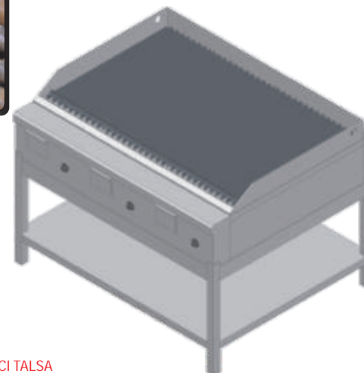
○ Parrilla Lineal SC3A 65 CITALISA