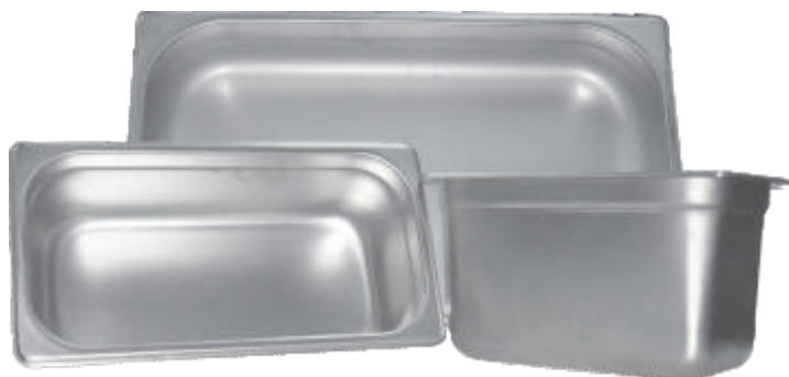
Azafates en Acero Inoxidable