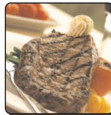
○ Cocina Mixta SCBA 85 CITALSA