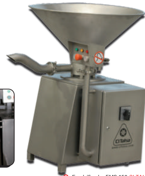
○ Emulsificador EMS 150 CITALISA