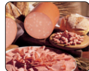
○ Mayor Extracción de Proteína.