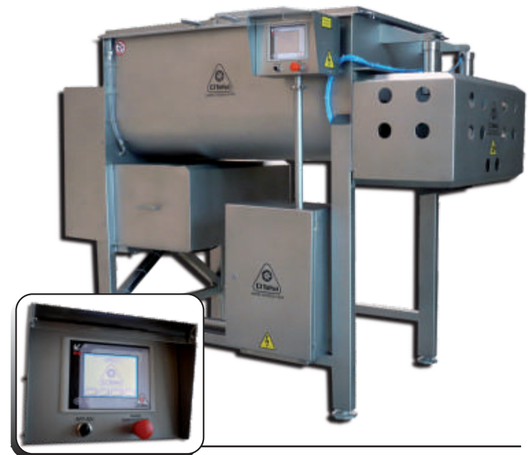
Control Ct01 CI TALSA