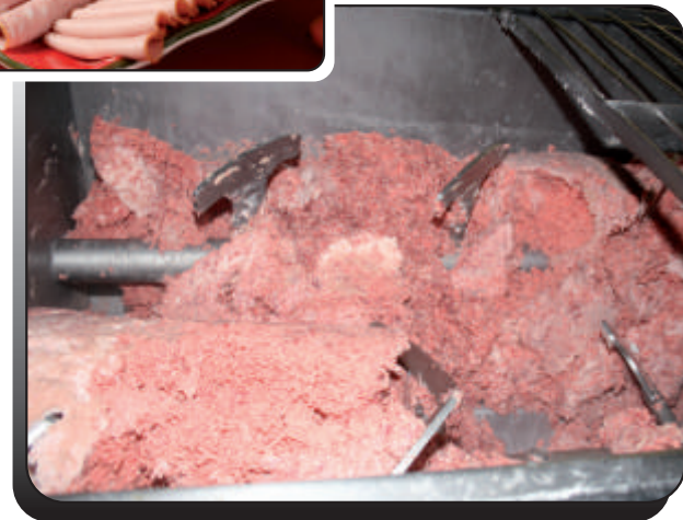
○ Aspas en Forma de Ancla