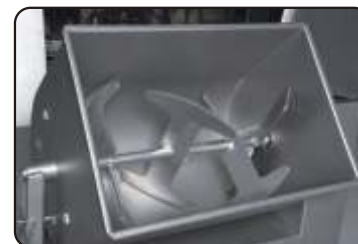
○ Mezclas homogéneas