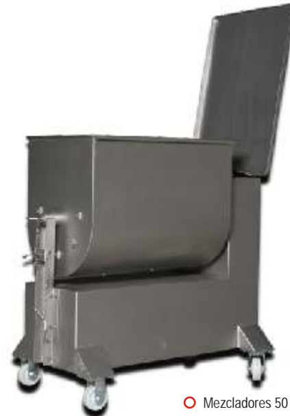
○ Mezcladores 50 - 100 - 200 CITALISA