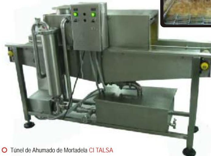
○ Túnel de Ahumado de Mortadela CITALISA